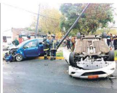
► Accidente de tránsito ocurrido en Providencia.