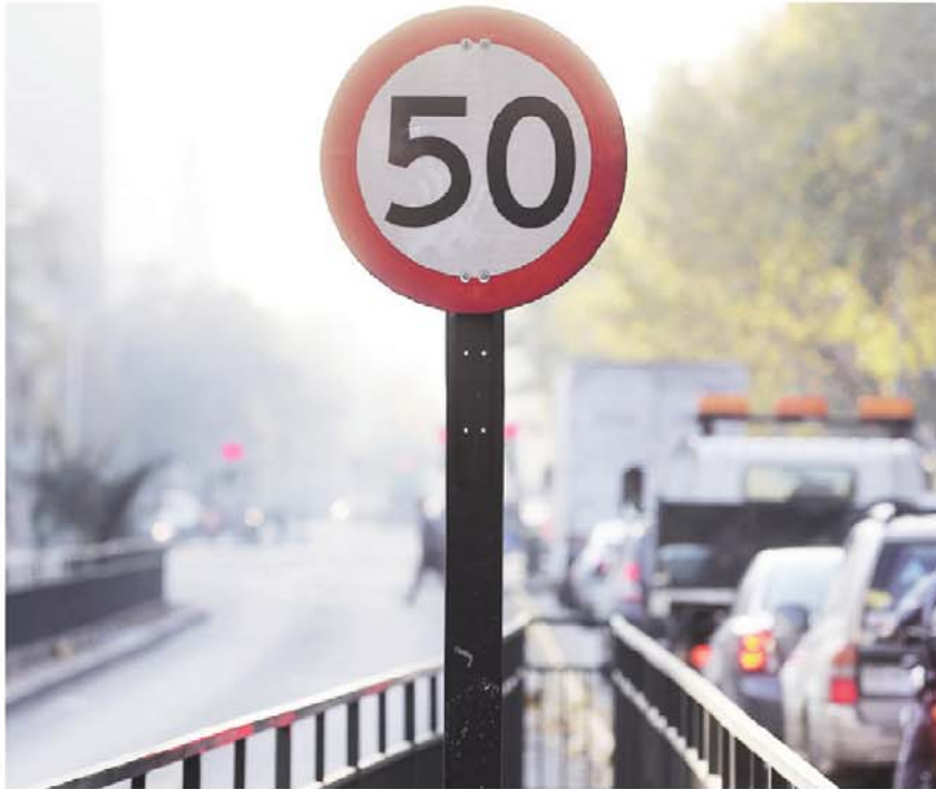
► Hace un año comenzó a regir la ley que redujo la velocidad a 50 km/h.