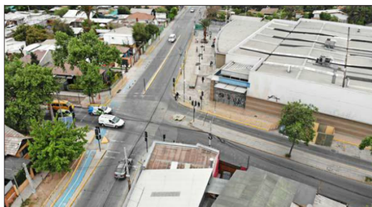
UBICACIÓN. La estación Riquelme, una de las futuras paradas de la Línea 2, se emplazará en Av. Padre Hurtado con la calle Riquelme (La Cisterna).

► TRANSPORTE. En 1959 dejaron de funcionar los tranvías eléctricos e imperaron los "trolebuses". En la década de 1960 este tipo de transporte también comenzó a desaparecer y reinan las "micros", que llegan a las 5.400 en 1978 y a 11.500 diez años después, según Memoria Chilena.