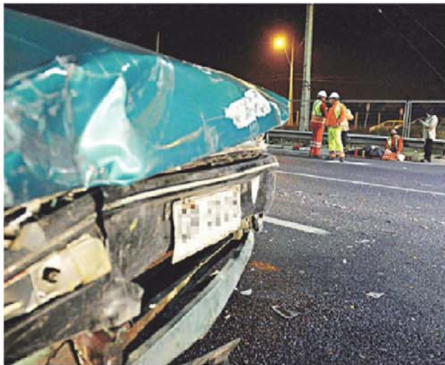
► Ministerio de Transportes dispuso mesas de trabajo para prevenir accidentes.