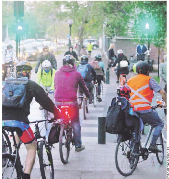
► Las guarderías de bicicletas en estaciones de Metro tienen un costo de $ 300.